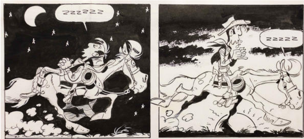
Morris, "Canyon Apache", détail de la planche 28 © Lucky Comic