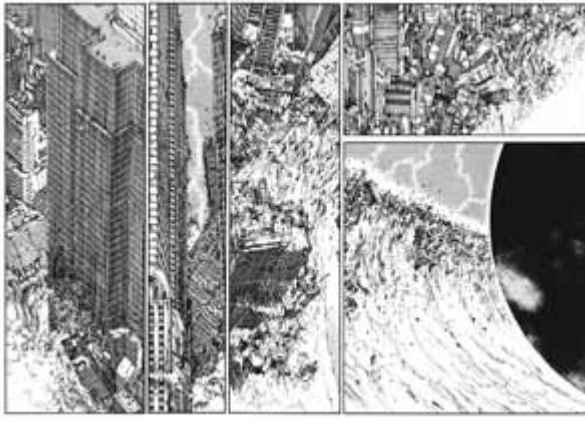
Otomo Kats uhiro in Akira éditions Glénat, 1993 © MASH.ROOM Co.,Ltd./Kodansha Ltd.

Cela explique peut-être au Japon l'importance du genre post-apocalyptique dans la production culturelle, genre beaucoup moins développé ailleurs. Survivre, endurer, reconstruire. D'un extrême à l'autre, des aléas incontrôlables des éléments naturels, aux systèmes impitoyables d'une société parfois (in)humaine, en passant par les éclats d'une violence qui pourrait à tout moment éclater, le Japon aime à se mettre à l'épreuve. Et, peut-être, se convaincre que quoi qu'il advienne, il y survivra.