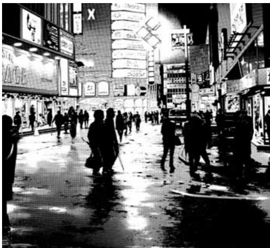
Shôhei Manabe Ushijima, l'usurier de l'ombre éditions Kana, 2008 © 2004 Shôhei Manabe/Shogakukan Inc